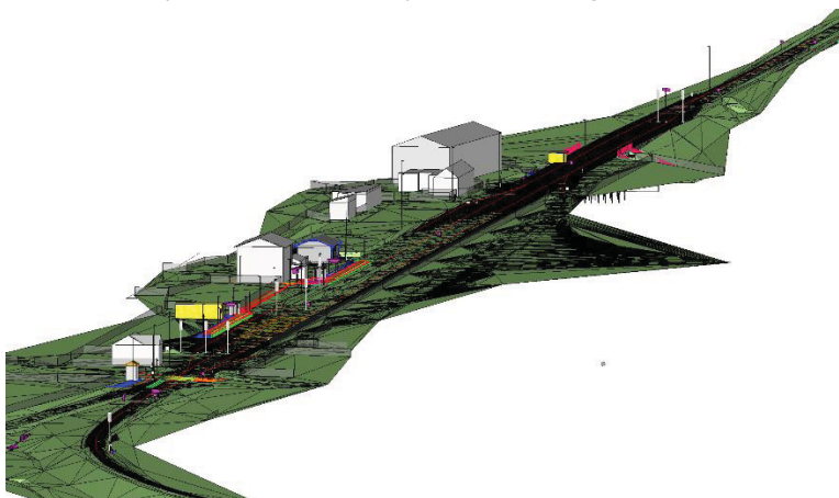
Obr. 2 pracovní výstup BIM modelu ŽST Čachovice – celkový pohled

Stavbu lze rozdělit na části Rokycany – Ejpovice (již dokončeno), Ejpovice – Plzeň-Doubravka (v realizaci, předpoklad dokončení v r. 2019) a Plzeň-Doubravka – Plzeň (již dokončeno). Stavbou dochází zejména ke zvýšení maximální traťové rychlosti na 120 – 160 km/h (resp. výhledově až 200 km/h) a zkrácení železniční trati o 6,09 km. Součástí druhého úseku stavby je přeložka trati v délce 6,482 km, na které je umístěna dvojice jednokolejných tunelů délky 4,150 km ražených technologií TBM.